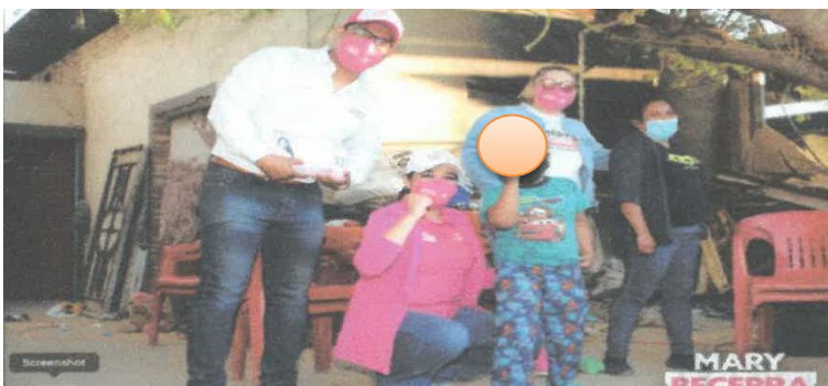
Fecha de publicación: 29 de abril Total Menores: 1 de sexo masculino Identificables: 1 de manera DIRECTA