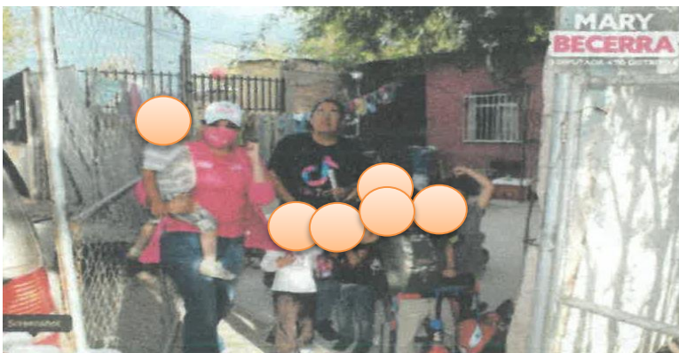
Fecha de publicación: 25 de abril Total Menores: 4 de sexo masculino y 2 de sexo femenino. Identificables: 6 de manera DIRECTA