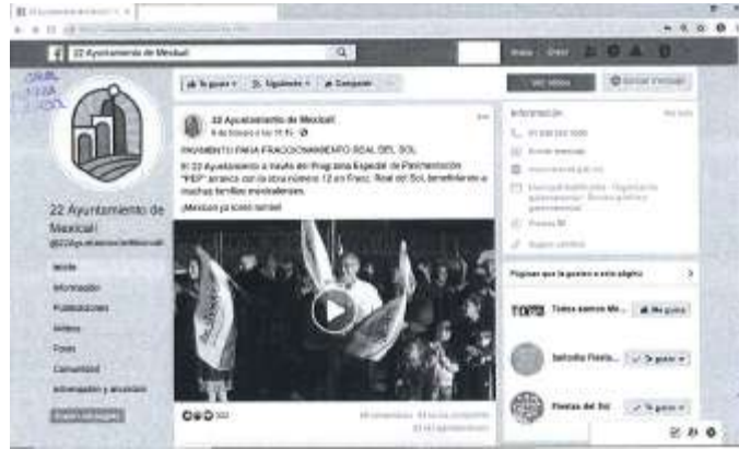
Imágenes con relación al acta circunstanciada identificada con el número IEEBC/SE/OE/AC08/04-03-2019