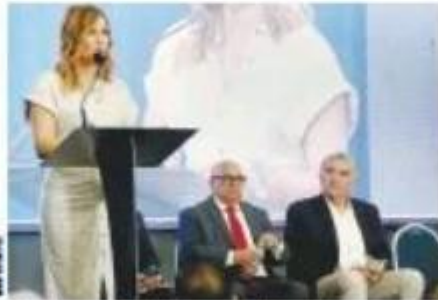
La Gobernadora del Estado acompañó al Secretario de Gobernación en su visita a Tijuana.

• En su visita a Baja California, Adán Augusto López Hernández, asegura que la propuesta del Presidente de la República no aplicará en la mayoría de los municipios de la frontera Norte. 04