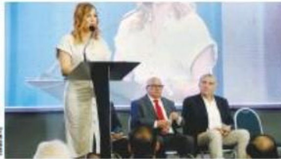
La Gobernadora del Estado acompañó al Secretario de Gobernación.