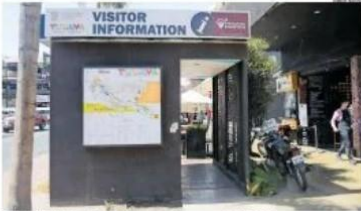
El edificio está abierto de las 10:00 a las 18:00 horas y es atendido por un operador bilingüe del Coloco.

LLAMA LA ATENCIÓN QUE NO HAY QUEJAS DESDE NOVIEMBRE