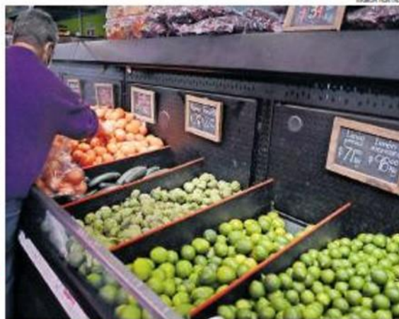
En diciembre, el precio del limón era de 28 a 35 pesos, de acuerdo con comerciantes