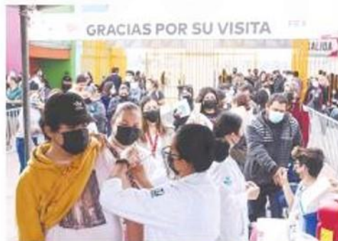
• Miles de adolescentes cachanitas recibieron ayer la primera dosis de la vacuna contra el Covid-19.

• Largas filas se formaron en el Centro de Ferias y Exposiciones de Mexicali, donde se aplicaron aproximadamente el 33% del total de dosis asignadas a esta ciudad. 02