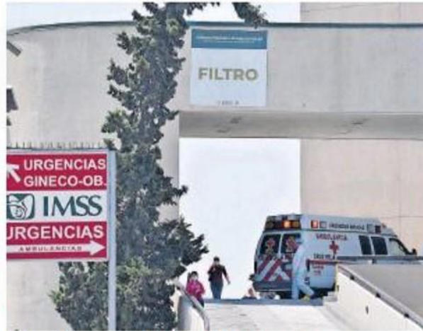
En Tijuana ofrecen anualmente 45 mil servicios de ambulancias

EL CORONAVIRUS ha representado 40 servicios de ambulancia al día en Tijuana, según los datos compartidos por la Cruz Roja