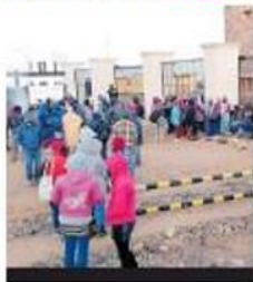
CORTESÍA DE LA EMPRESA

SERÁ EN PARCIALIDADES Jornaleros exigen pago de aguinaldo Son 701 los jornaleros afectados en el Valle de San Quintín por el adeudo de aguinaldo y salarios de las últimas semanas de diciembre y la primera de enero. La empresa les pagará hoy viernes. Pag. 8